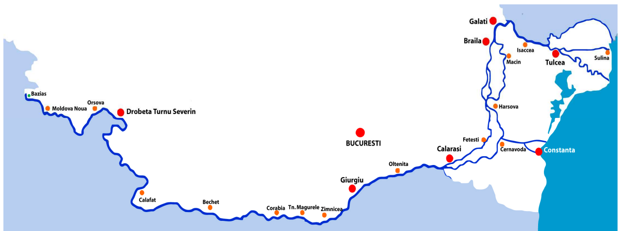
The Romanian Danube

Avand un potential ridicat pentru dezvoltarea centrelor logistice, datorita conexiunii cu Marea Neagra (asigurata prin Canalul Dunare-Marea Neagra), Dunarea ocupa un rol important in deservirea fluxurilor de marfuri care vin din Orientul Indepartat si care sunt destinate statelor Central si Est Europene.